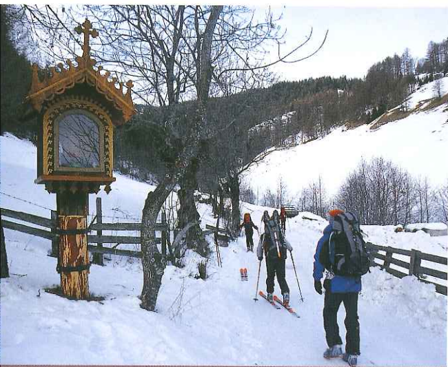
De nombreux oratoires jalonnent la montée à la Torscharte.